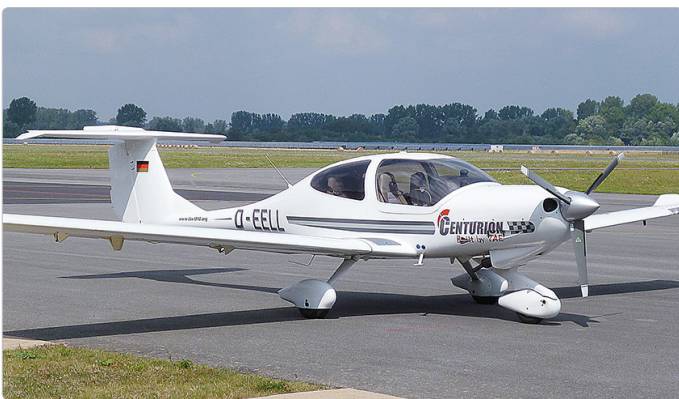
D-EELL – Diamond Air DA40 TDI