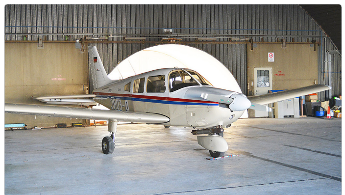
D-EORC – Piper PA28

Mehr Information zu unserem Flugzeugpark gibt es unter diesem Link .