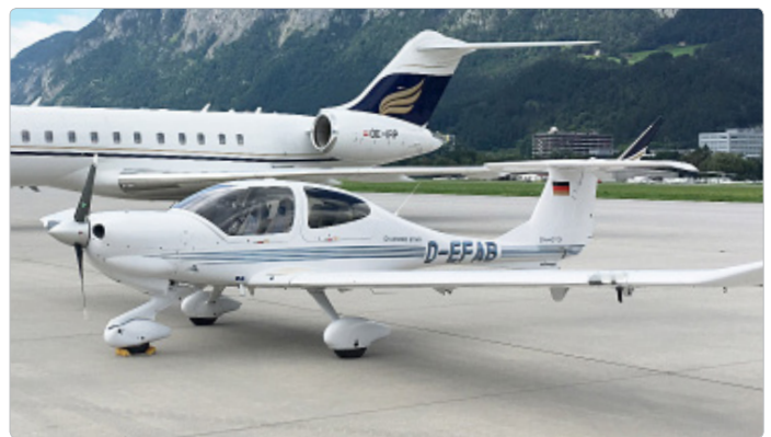
D-EFAB – Diamond Air DA40 TDI